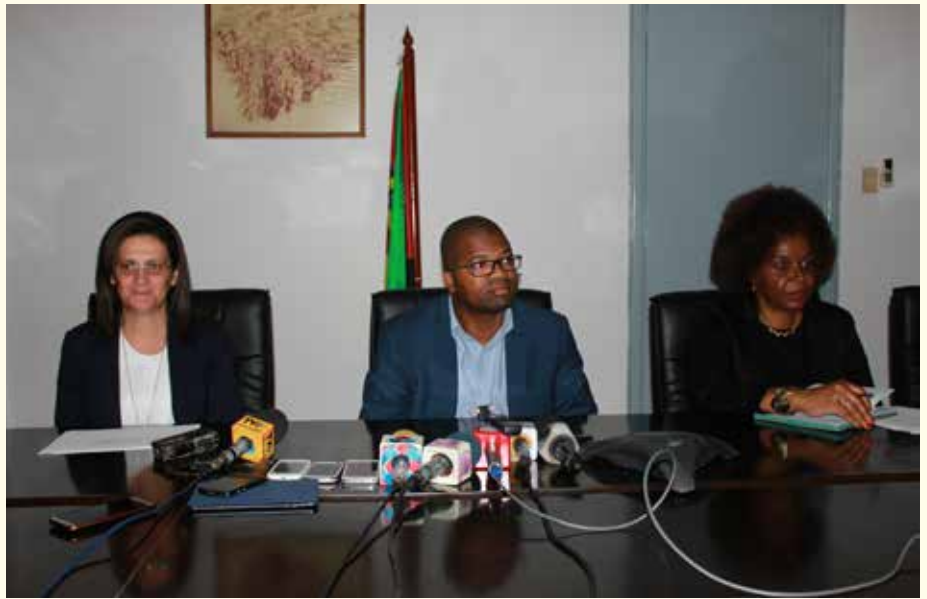
A autorização da venda do frango brasileiro foi anunciada sexta-feira numa conferência de imprensa conjunta entre várias instituições