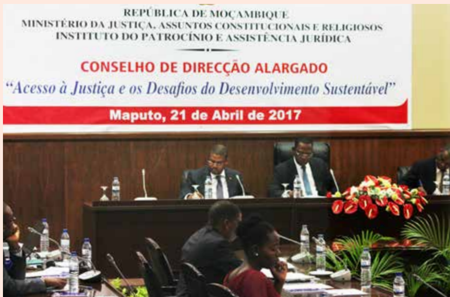
Vários constrangimentos foram levantados no Conselho de Direcção do IPAJ

Dados do IPAJ indicam que no ano passado foram assistidos 184 mil processos judiciais de pessoas carenciadas, um crescimento de 9,7 por cento comparativamente ao ano de 2015. Destes casos, a província de Cabo Delgado é a que teve o maior número, com 22.085, e Gaza com o número mais baixo, 4740. Este baixo índice de