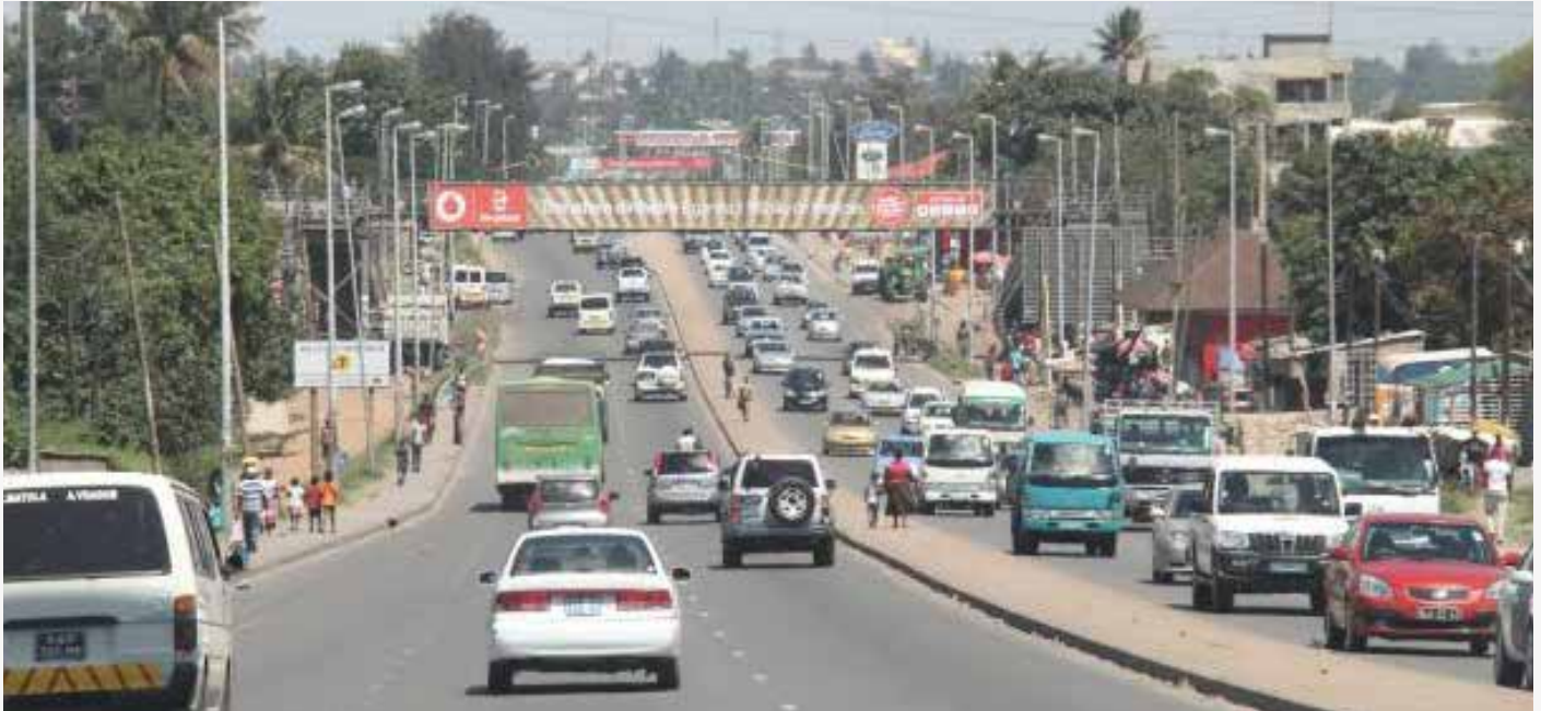
A EN4 passará a ter quatro faixas para cada sentido