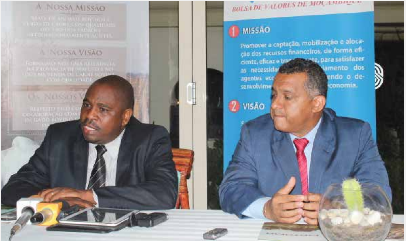
Momento depois da assinatura do contrato de adesão à BVM pela empresa MATAMA

A Bolsa de Valores de Moçambique (BVM) anunciou publicamente a admissão da empresa Matadouro da Manhiça (MATAMA) ao Mercado de Cotações Oficiais da Bolsa. Para o efeito, a BVM e a MATAMA rubricaram há dias um contrato, num acto que contou com a presença de operadores da bolsa, empresas públicas e privadas cotadas e em processo de admissão, entre outros.